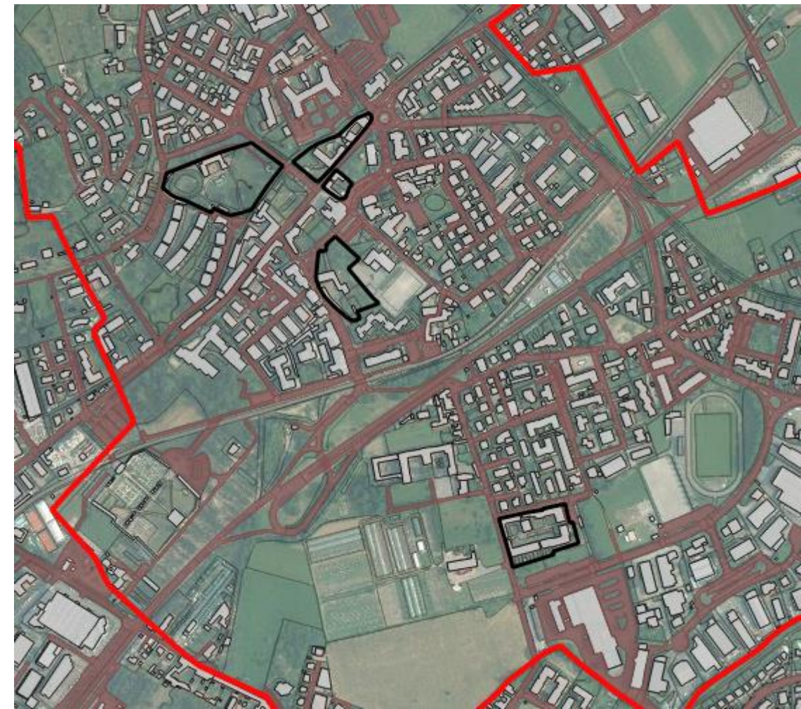
Nuclei e edifici di antica formazione di Torre Boldone

Stabilire dei cancelli che impediscano l'accesso ai nuclei storici e alle zone già colpite dal sisma, avendo cura di mantenere una distanza di sicurezza adeguata.